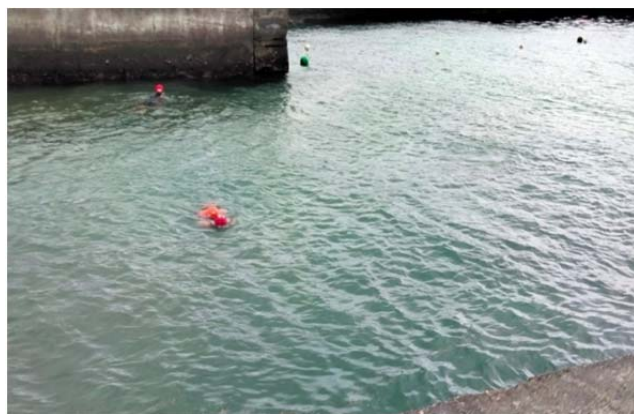
體育署救生員班-帶人法