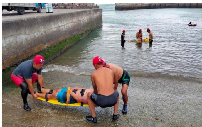
體育署救生員班-長背板救援