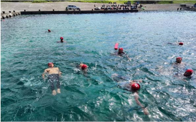
體育署救生員班-入訓測驗