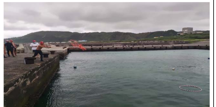
體育署救生員班-拋繩術