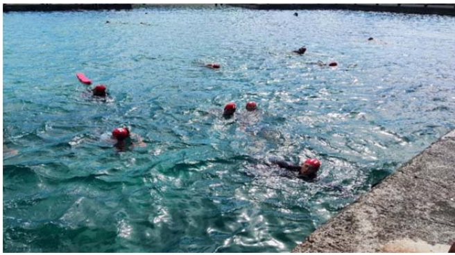
體育署救生員班-基本救生