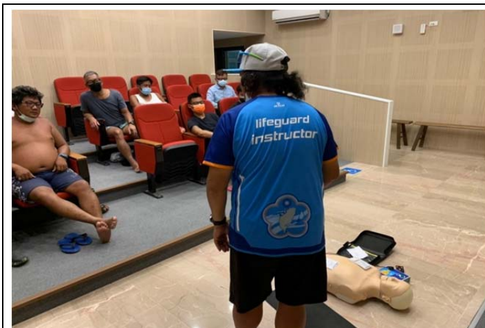
體育署救生員班-基本救命術