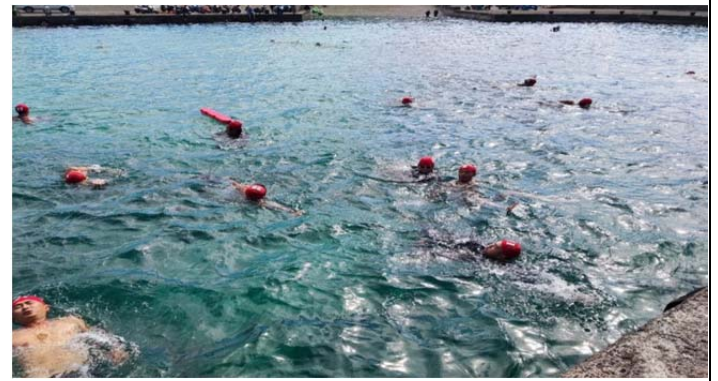
體育署救生員班-基本救生