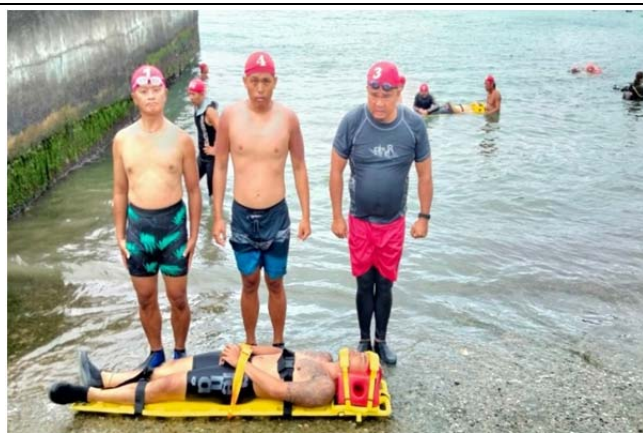
體育署救生員班-假人拖帶