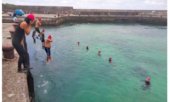
體育署救生員班-入水法