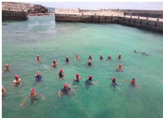
體育署救生員班-踩水