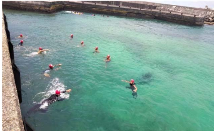
體育署救生員班-模擬救溺