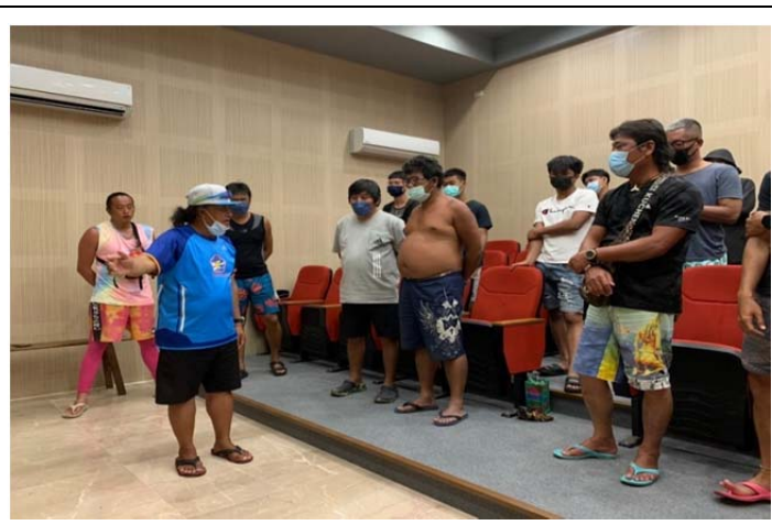
體育署救生員班-基本救命術