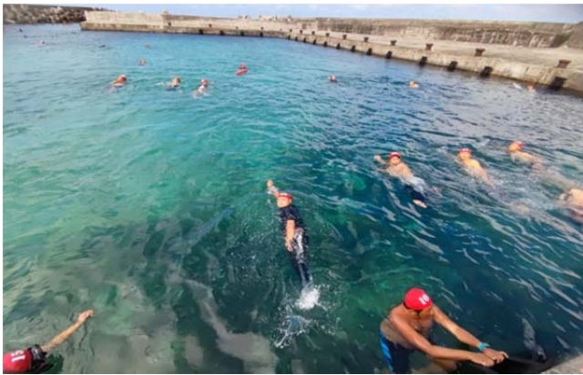
體育署救生員班-救生游法