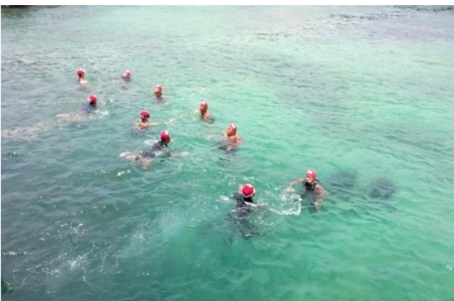
體育署救生員班-模擬救溺