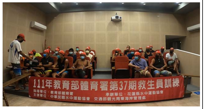
體育署救生員班-筆試