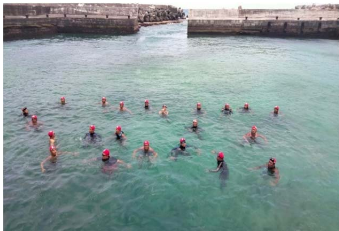
體育署救生員班-踩水