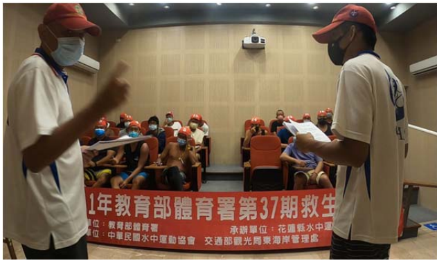
體育署救生員班-筆試