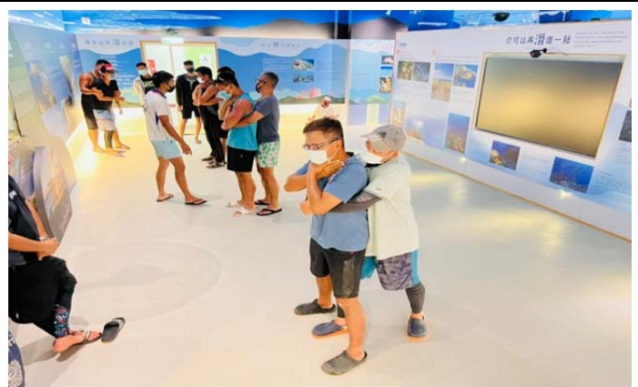
體育署救生員班-基本救命術