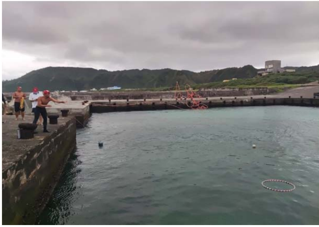
體育署救生員班-拋繩術