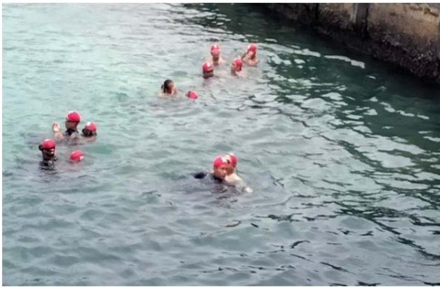
體育署救生員班-模擬救溺