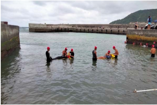
體育署救生員班-長背板救援