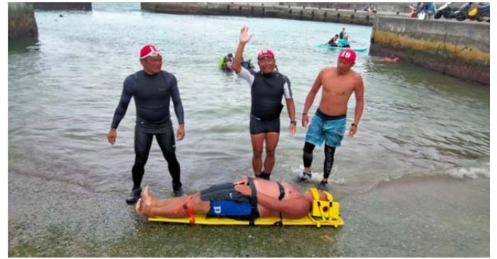
體育署救生員班-長背板救援