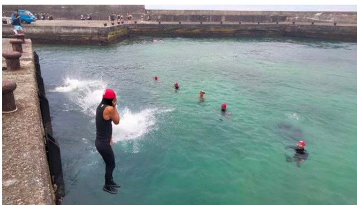
體育署救生員班-入水法