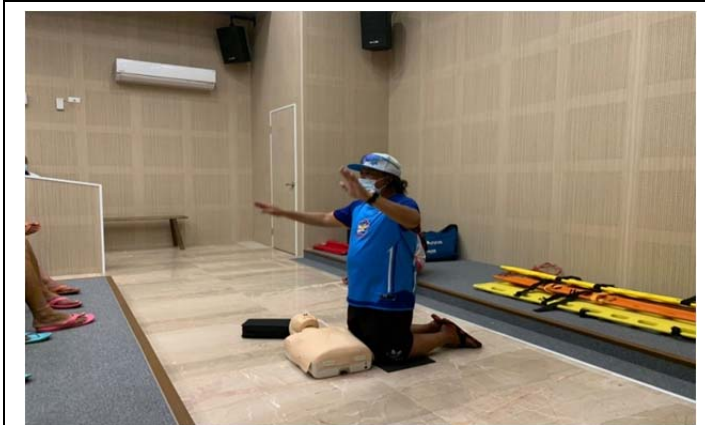
體育署救生員班-基本救命術