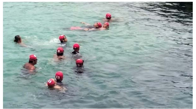
體育署救生員班-模擬救溺