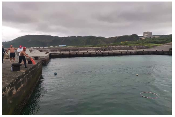
體育署救生員班-拋繩術