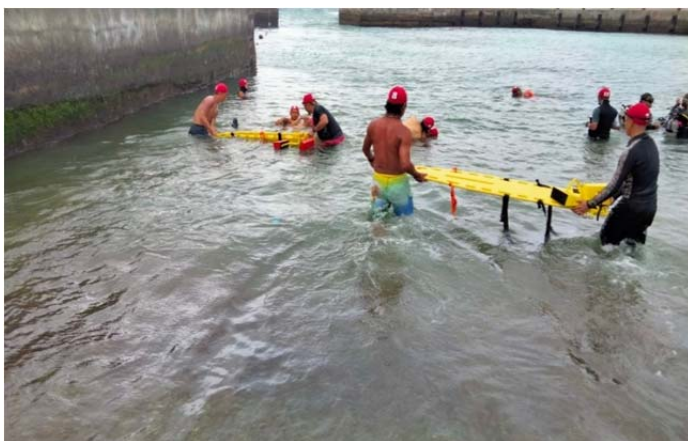
體育署救生員班-長背板救援