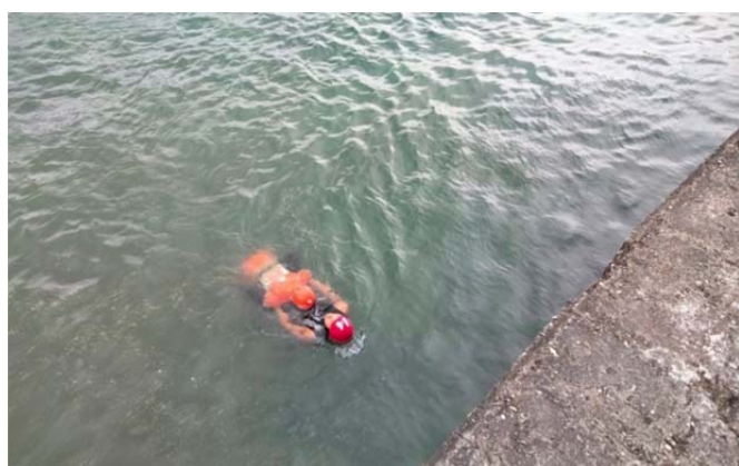
體育署救生員班-帶人法