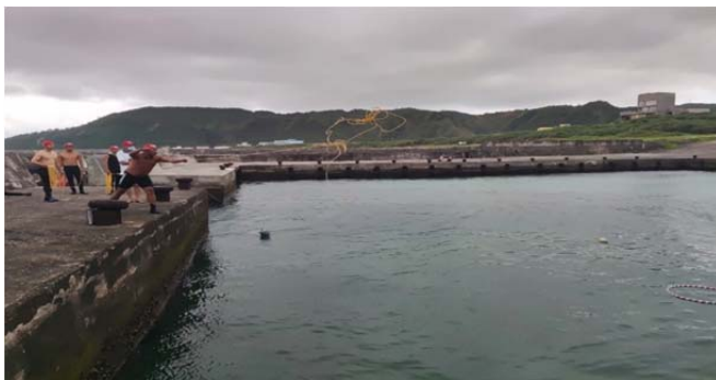
體育署救生員班-拋繩術