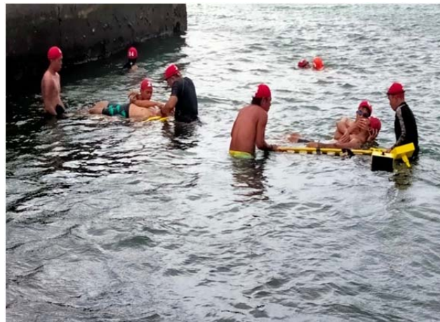
體育署救生員班-長背板救援