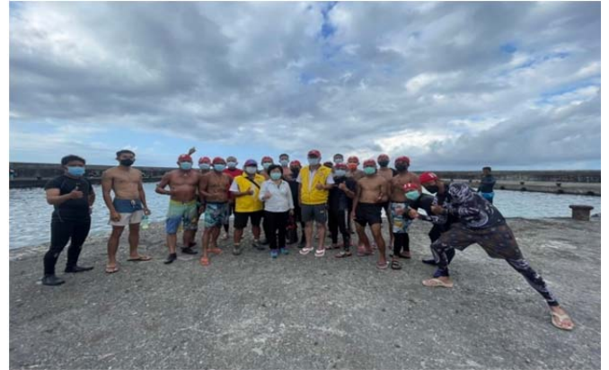
體育署救生員班-開訓