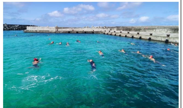
體育署救生員班-救生游法