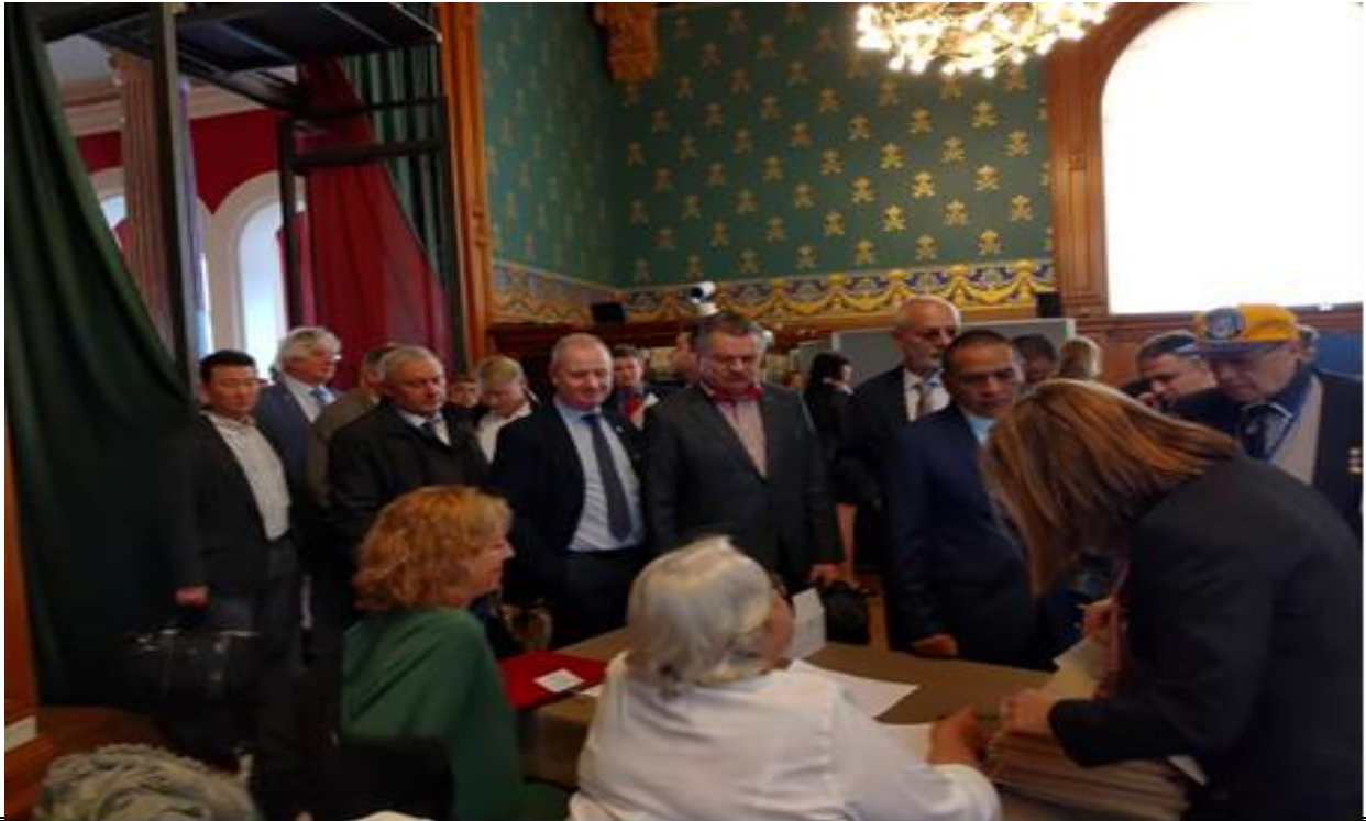
說明：2019 年世界水中運動聯盟會員大會各國代表報到