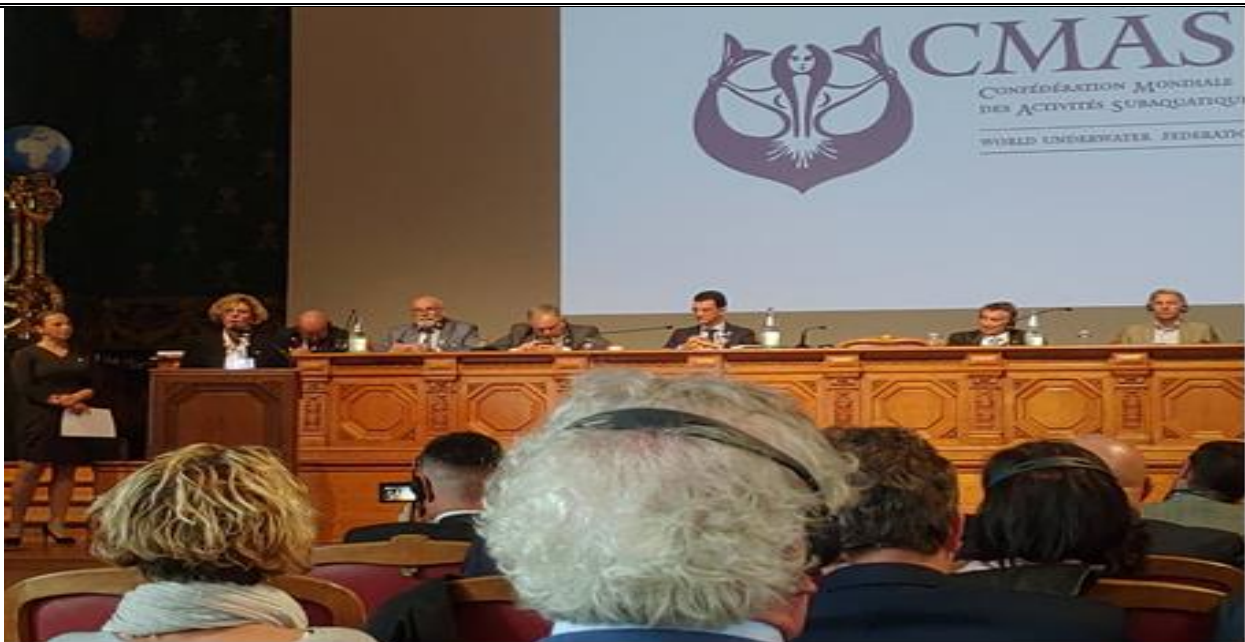
說明：比利時潛水與運動委員會長介紹該會發展前瞻性